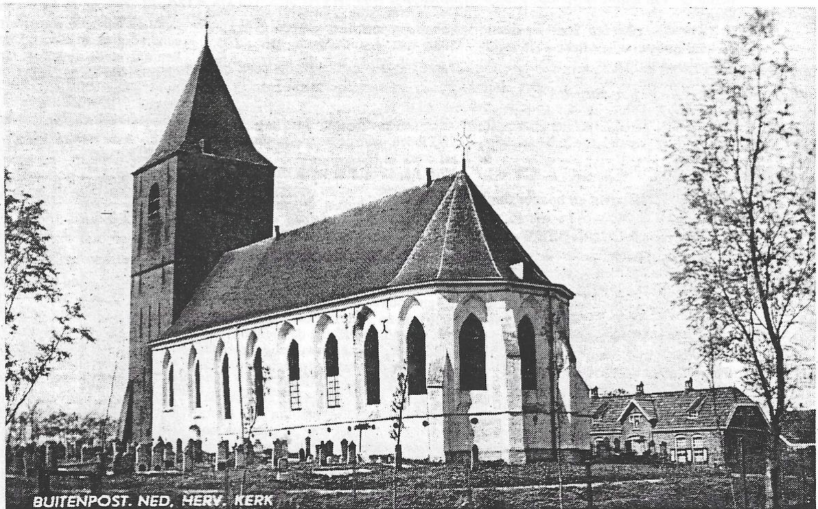
BUIENPOST. NED. HERV. KERK Ned. Herv. kerk te Buitenpost met rechts op de achtergrond de diaconiewoningen, die ongeveer in de jaren tachtig van deze eeuw zijn afgebroken. Nu is daar de snoepwinkel van de fa. Meetsma gevestigd.