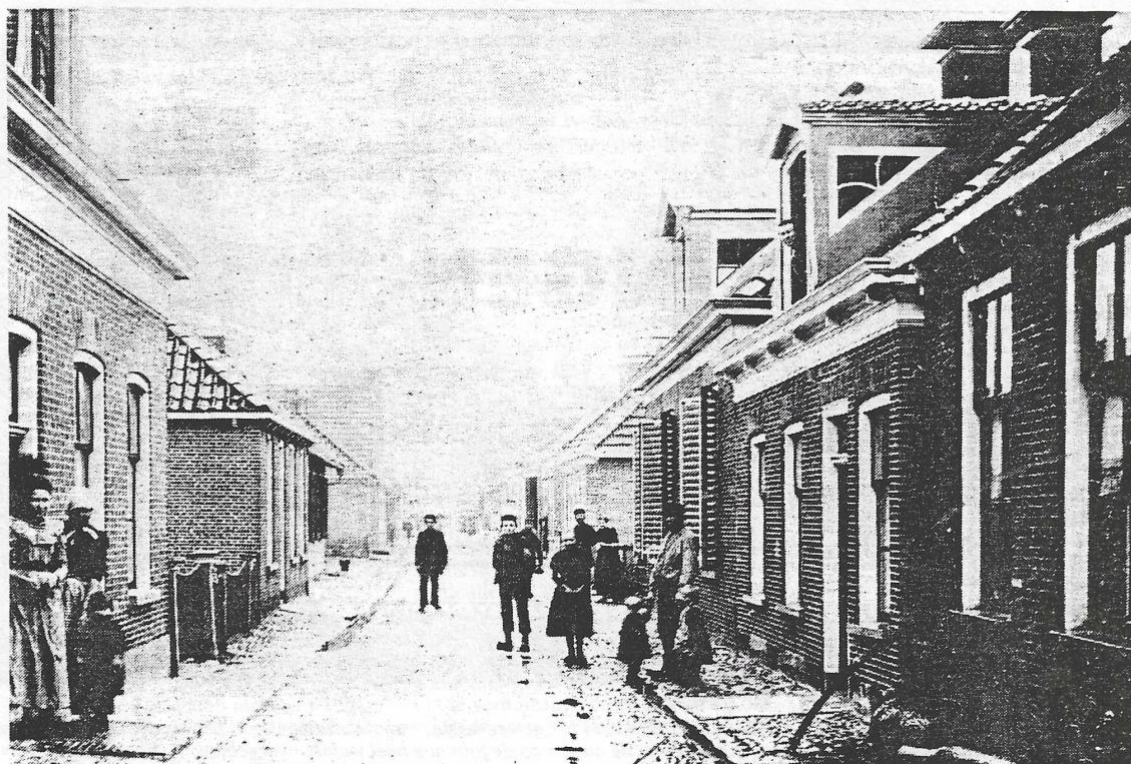
Hier staan we in de Kerkstraat met de rug naar de Ned. Herv. kerk. Links op de achtergrond is nog heel vaag het diaconie-huis 'het Blok' te zien. Nu is daar supermarkt 'Aldi' gevestigd.

Dit was een publicatie van de 'Stichting Oud-Achtkarspelen', die zich ten doel stelt belangstelling te wekken voor de historie van de eigen gemeente.